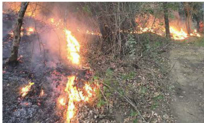
Un'immagine del vasto rogo tra Dudda e Ponte agli Stolli