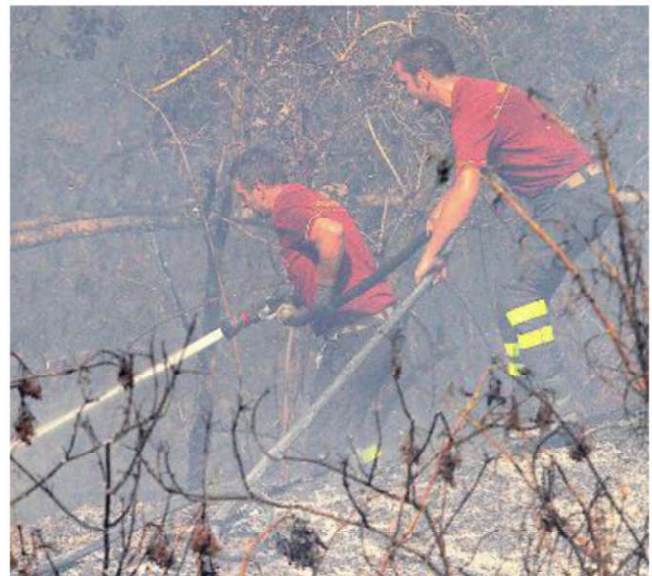
Decine di pompieri, volontari, carabinieri forestali, vigili urbani e uomini della Croce Rossa sono intervenuti sul rogo doloso di Ponte agli Stoll

ha fatto un altro lancio. A terra decine di uomini hanno affrontato le fiamme che sono arrivate sulla vetta della collina mandando in cenere castagni, querce, quercioli e altre preziose alberature.